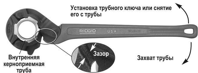
Рис. 2 – Работа с колоночным трубным ключом